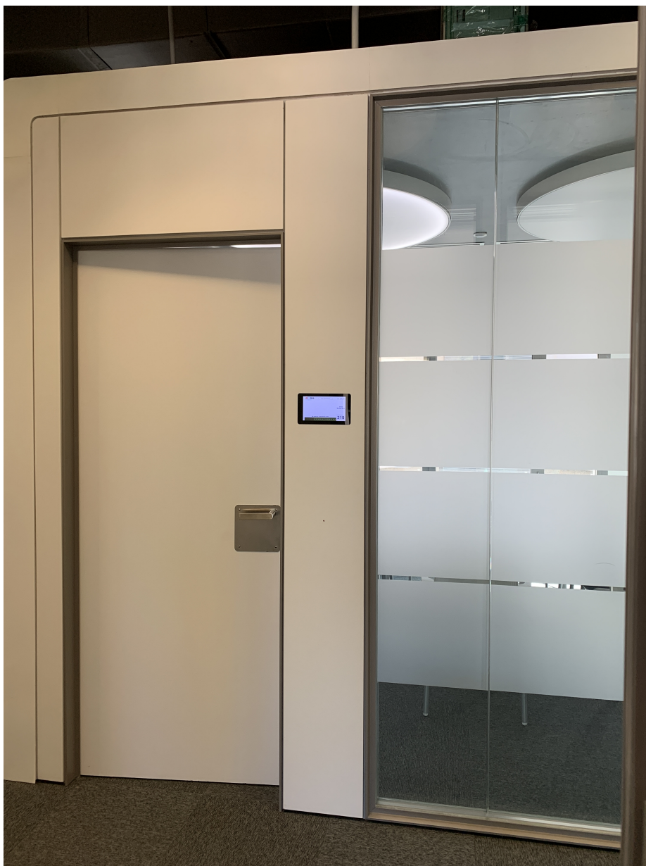
Detalle de la puerta que hay que instalar.