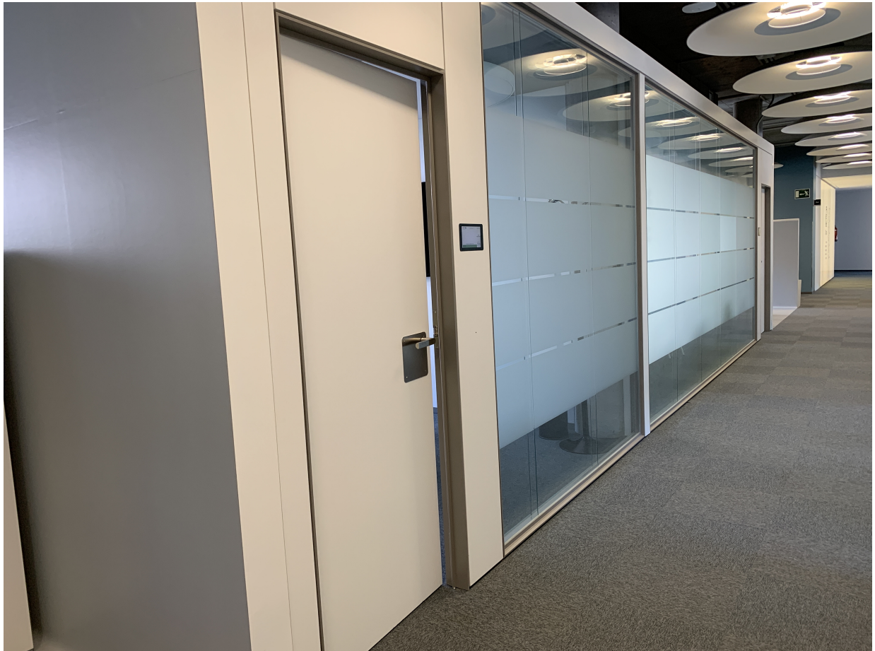
Vista global del aspecto a imitar (excepto pared gris).