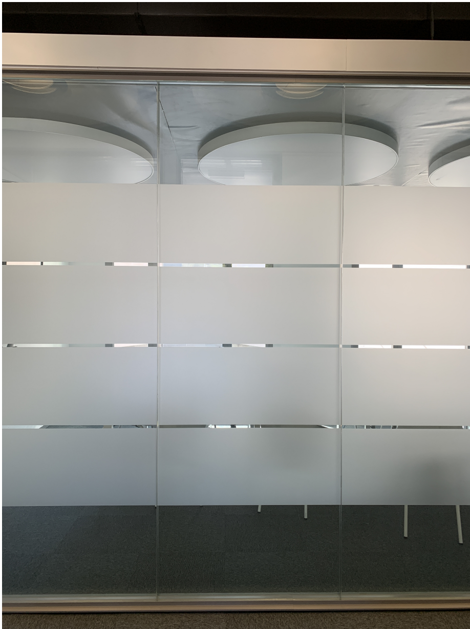
Detalle de la mampara de vidrio con vinilo.